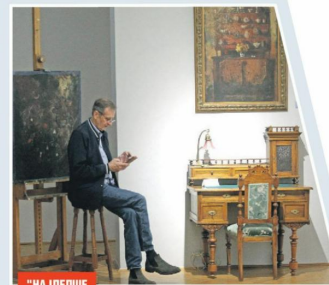
"НАЈЛЕПШЕ ПРИЧЕ": Са изложбе

Посетиоци ће моћи да уживају у делима из разних периода, а слике прате и приче које ће бити сабране у посебном каталогу